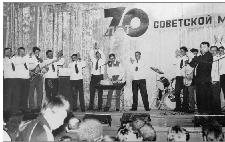
Участники художественной самодеятельности РОВД на сцене ДК выступают с праздничным концертом, посвященном Дню советской милиции. 10.11.1987 г.